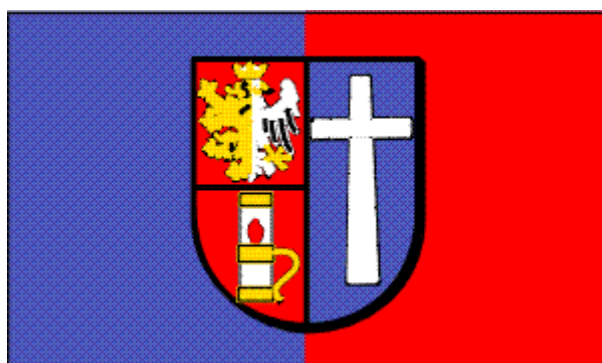
Flaga Powiatu Krośnieńskiego